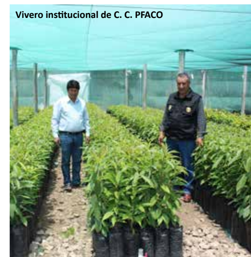
Vivero institucional de C. C. PFACO