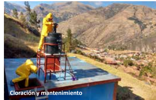
Cloración y mantenimiento