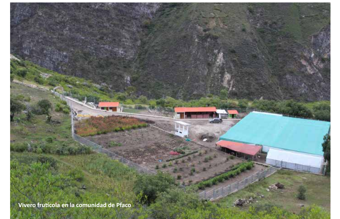
Vivero frutícola en la comunidad de Píaco