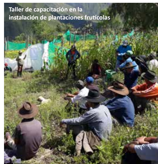
Taller de capacitación en la instalación de plantaciones frutícolas