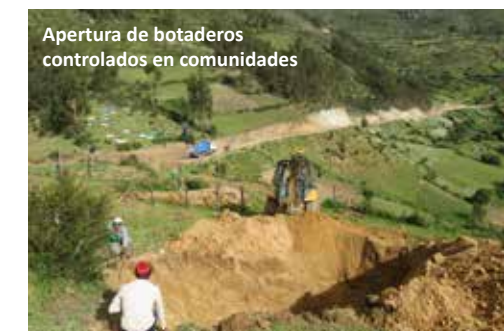
Apertura de botaderos controlados en comunidades