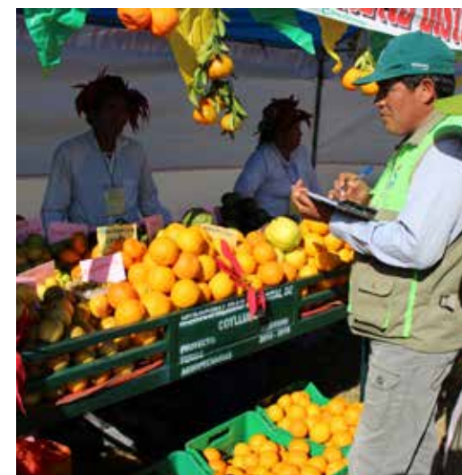
Taller de capacitación en control de la mosca de fruta