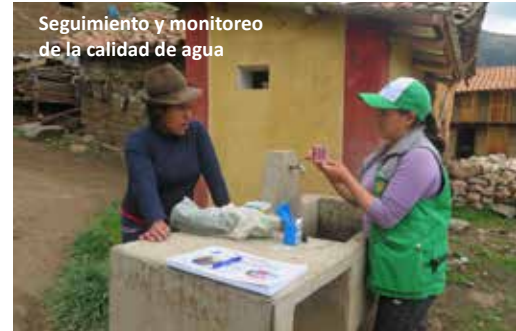
Seguimiento y monitoreo de la calidad de agua