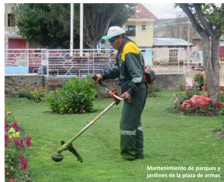
Mantenimiento de parques y jardines de la plaza de armas