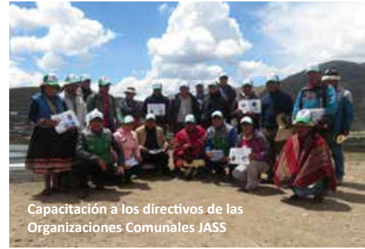
Capacitación a los directivos de las Organizaciones Comunitarias JASS