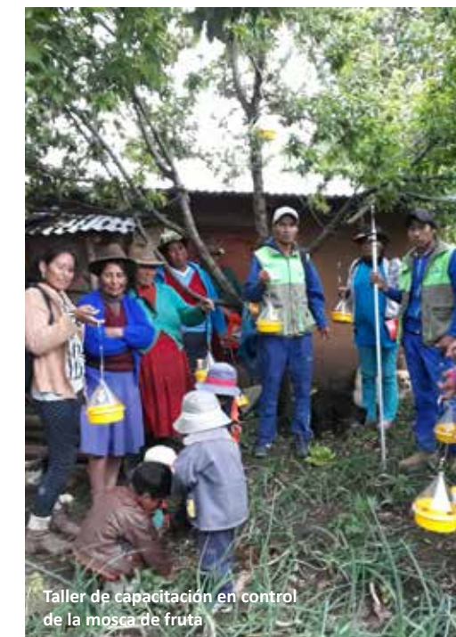
Taller de capacitación en control de la mosca de fruta