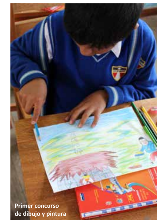
Primer concurso de dibujo y pintura