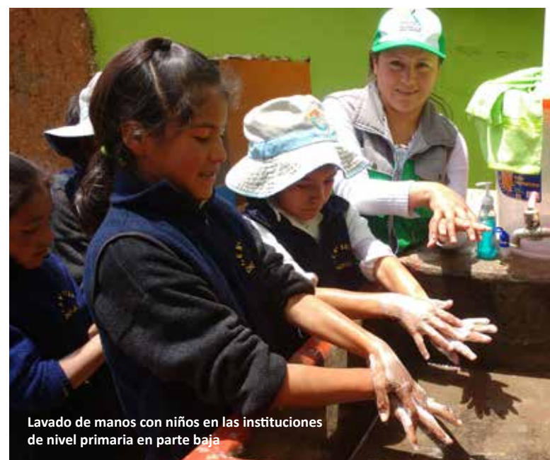
Lavado de manos con niños en las instituciones de nivel primaria en parte baja