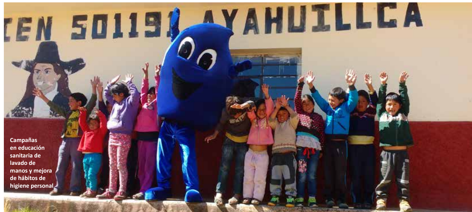
Campañas en educación sanitaria de lavado de manos y mejora de hábitos de higiene personal