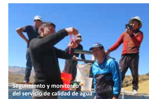
Seguimiento y monitoreo del servicio de calidad de agua