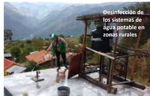
Desinfección de los sistemas de agua potable en zonas rurales